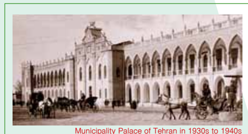
Municipality Palace of Tehran in 1930s to 1940s