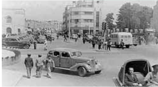
A street in Tehran during the 1930s