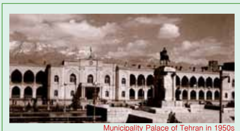
Municipality Palace of Tehran in 1950s