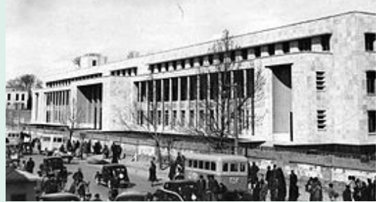
National Bank of Iran, in the 1940s

ในปี ค.ศ. 1948 สำนักการผังเมืองขึ้น และในปี ค.ศ. 1968 มีการอนุมัติผังเมืองรวมของกรุงเตหะรานขึ้นเป็นแผนแรก เพื่อแก้ปัญหาต่างๆ ของเมือง เช่น การขาดแคลนสาธารณูปโภคและสาธารณูปการปัญหาที่อยู่อาศัย และมลภาวะอากาศเป็นพิษ เป็นต้น แต่เนื่องจากการปฏิวัติในปี ค.ศ. 1979 และสงครามอิหร่าน - อิรัก (ค.ศ.1980 - 1988) ทำให้แผนต่างๆ เหล่านั้นชะงักงัน อย่างไรก็ตาม ภายหลังจากสงครามยุติลง รัฐบาลอิหร่านได้เร่งพัฒนาบ้านเมืองให้ทันสมัยมากขึ้นในทุกด้าน