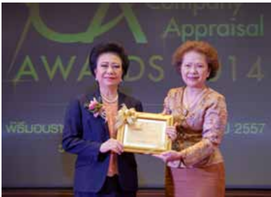
รางวัลบริษัทประเมินดีเด่น รองอันดับที่ 1 บริษัท ไทยประเมินราคา ลินน์ ฟิลลิปส์ จำกัด